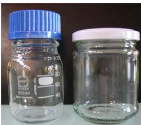
Geeignete Gläser für die Dampfsterilisation (links: Gewindflasche, rechts: Konfitüreglas)