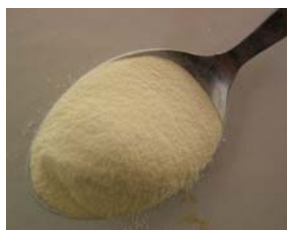
Ein gehäufter Kaffeelöffel YPD-Agar entspricht 4 g (das reicht für zwei Platten)