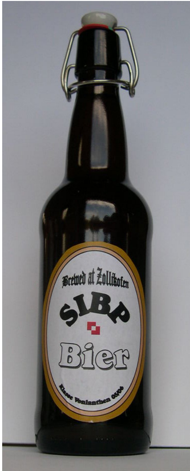
SIBP-Homebrew! Das erste (?) original SIBP-Bier